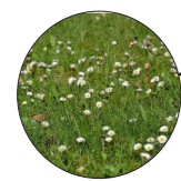
Gras met bloemmengsel